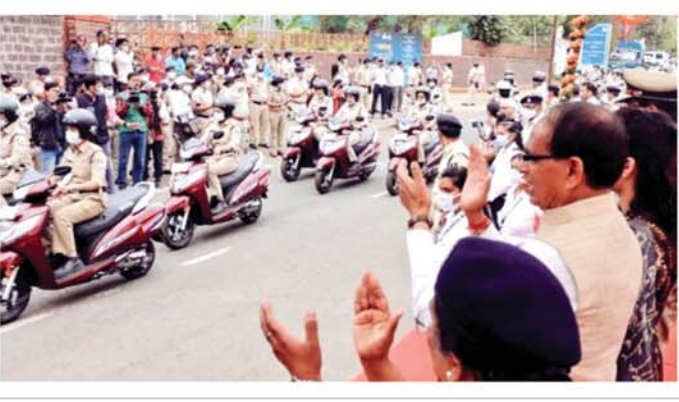
संवाददाता ■ भोपाल मुख्यमंत्री शिवराज सिंह चौहान ने शुक्रवार को राजधानी भोपाल में आयोजित एक कार्यक्रम में महिलाओं के लिए एक बड़ी घोषणा की है। वे लाल परेड मैदान स्थित मोतीलाल नेहरू स्टेडियम में आयोजित महिला पुलिस कर्मचारियों को स्कूटर वितरण कार्यक्रम में संबोधित कर रहे थे। सीएम शिवराज सिंह चौहान ने

कहा कि पुलिस विभाग में 30 प्रतिशत पदों पर महिलाओं की भरती होगी। इससे महिलाओं को अधिक अवसर मिलेंगे। उन्होंने कहा कि आधी आबादी को न्याय के बिना न देश आगे बढ़ सकता है और न प्रदेश आगे बढ़ सकता है, इसलिए मैंने तय किया है कि पुलिस विभाग में 30 प्रतिशत बेटियों की भरती अनिवार्य होगी, सीएम ने कहा आज पुलिस विभाग में कार्य करने वाली बेटियां पूरी कर्तव्यनिष्ठ के साथ अपना उत्तरदायित्व निभाकर स्वयं को सिद्ध कर रही हैं। इस अवसर पर सीएम शिवराजसिंह चौहान ने कहा यह जो पुरुष प्रधान समाज है, उसकी व्यवस्था से कई बार मन दुख और पीड़ा से भर जाता है।