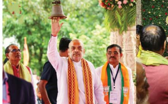
इन्दौर। केन्द्रीय गृह और सहकारिता मंत्री अमित शाह आज इन्दौर जिले के जनापाव पहुँचे। उन्होंने भगवान परशुराम की जन्मस्थली पहुँचकर दर्शन और पूजन किया। इस अवसर पर मुख्यमंत्री शिवराजसिंह चौहान, इन्दौर जिले के प्रभारी तथा गृहमंत्री डॉ. नरोत्तम मिश्रा, सांसद वी.डी. शर्मा, सहित अन्य जनप्रतिनिधि मौजूद थे।

केरल के एर्नाकुलम जिले में 5 साल की बच्ची से रेप के बाद गला दबाकर हत्या कर दी गई। आरोपी ने बच्ची का शव बोर में डालकर डुपिंग ग्राउंड में फेंक दिया था। पुलिस ने आरोपी को गिरफ्तार कर लिया है। वह