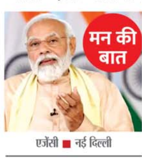
एजेंसी ■ नई दिल्ली

अभियान के लिए जैसे पूरा देश एक साथ आया था। वैसे ही हमें इस बार भी फिर से हर घर तिरंगा फहराना है और इस परंपरा को लगातार आगे बढ़ाना है।