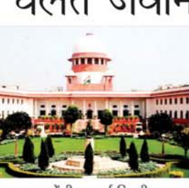
■ नई दिल्ली