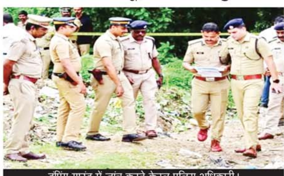
डुपिंग ग्राउंड में जांच करते केरल पुलिस अधिकारी।