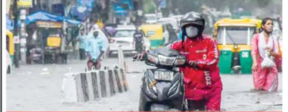
दिल्ली के कई इलाकों में पानी भर जाने से आने-जाने वालों को काफी मुश्किल करनी पड़ी।

देश के 8 राज्यों में तेज बारिश के चलते बाढ़ जैसे हालात बन चुके हैं। इनमें असम, हिमाचल प्रदेश, उत्तराखंड, केरल, तटवर्ती गोवा-कर्नाटक और नगालैंड के कई इलाके पानी में डूब गए। कर्नाटक में बारिश के चलते अब तक 4 लोगों की जान चली गई। वहीं उत्तराखंड में 154 सड़कें बंद कर दी गईं। असम के 6 जिलों में 121 गांवों के करीब 22 हजार लोग बाढ़ से प्रभावित हैं। दिल्ली में शनिवार को मौसम की पहली भारी बारिश हुई। इससे कई इलाकों में सड़कों पर पानी भर गया, जिससे ट्रैफिक की समस्या भी देखने को मिली। जम्मू-कश्मीर के कुछ में सेना के दो जवानों के डोयंगर माले में डूबने की आशंका है। अधिकारियों ने बताया- भारी बारिश के चलते डोयंगर नाला उफान पर है। दोनों जवान नाला