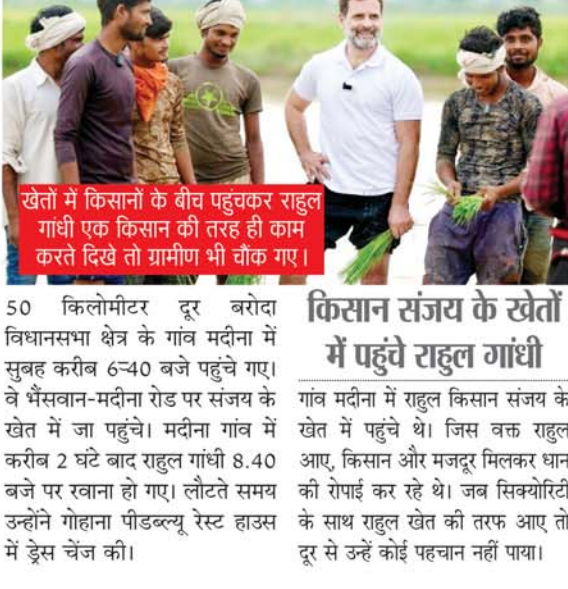
खेतों में किसानों के बीच पहुंचकर राहुल गांधी एक किसान की तरफ ही काम करते दिखे तो ग्रामीण भी चौक गए।

एजेंसी ■ सोनीपत कांग्रेस नेता राहुल गांधी शनिवार सुबह अचानक हरियाणा के सोनीपत में रुके। यहां उन्होंने किसानों के साथ खेतों में धान की रोपाई की। उन्होंने ट्रैक्टर चलाकर खेत की जुताई भी की। इस दौरान किसानों और खेत मजदूरों के साथ खेती-किसानी पर बातचीत भी की। राहुल ने किसानों के साथ ही बैठकर नाश्ता भी किया। राहुल गांधी दिल्ली से शिमला जा रहे थे। वे जीटी रोड पर कुंडली बॉर्डर पहुंचे तो किसानों के बीच जाने का प्रोग्राम बना लिया और सोनीपत के ग्रामीण इलाके का रुख कर लिया। राहुल गांधी NH 48 से मुखल होते हुए कुण्ड रोड से बाढ़पास के रास्ते गोहाना की तरफ रवाना हुए। इसके बाद वे अपने रूट से हट कर करीब